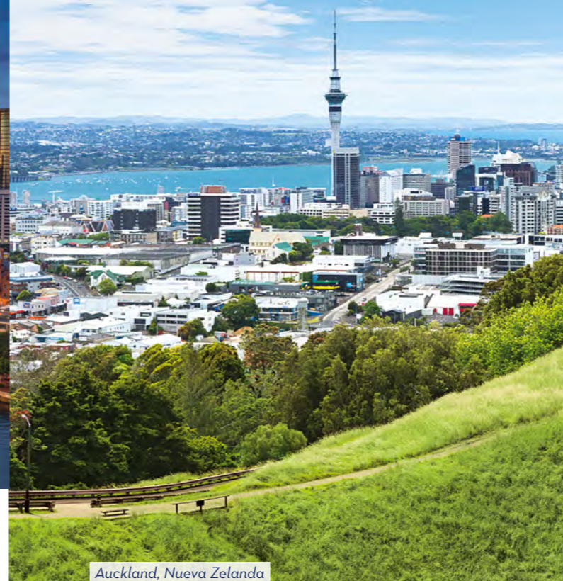
Auckland, Nueva Zelanda